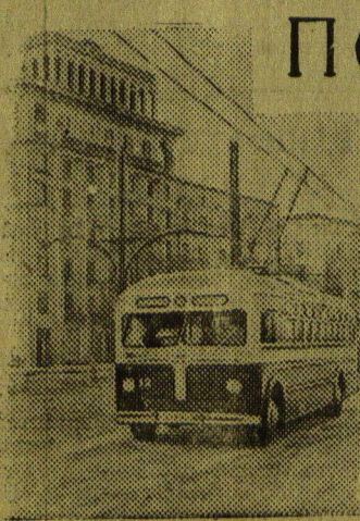
В ГОРЬКОМ пушена новая троллейбусная линия протяжением 20 километров. На снимке: троллейбус на улице Коминтерна.

мьями. Для них предназначены отдельные комнаты. Желающих поехать в семейный дом отдыха очень много. Поступают запросы на путевки от рабочих и служащих различных городов страны.